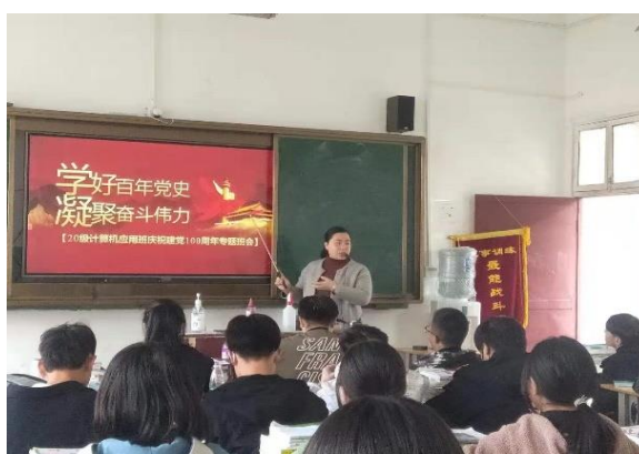
学党史、知党恩、跟党走主题班会