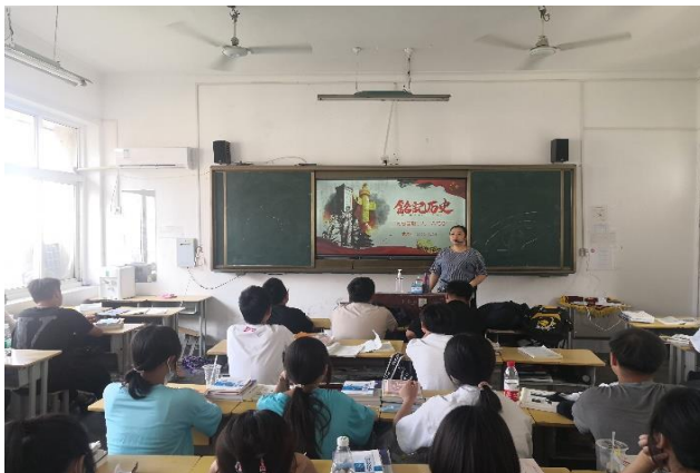
九·一八爱国主义教育